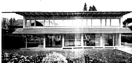
329%-Plusenergie-Einfamilienhaus Moosweg in Riehen, 2019 (Architektur: Felippi Wyssen Architekten; Holzbau: PM Mangold Holzbau AG).